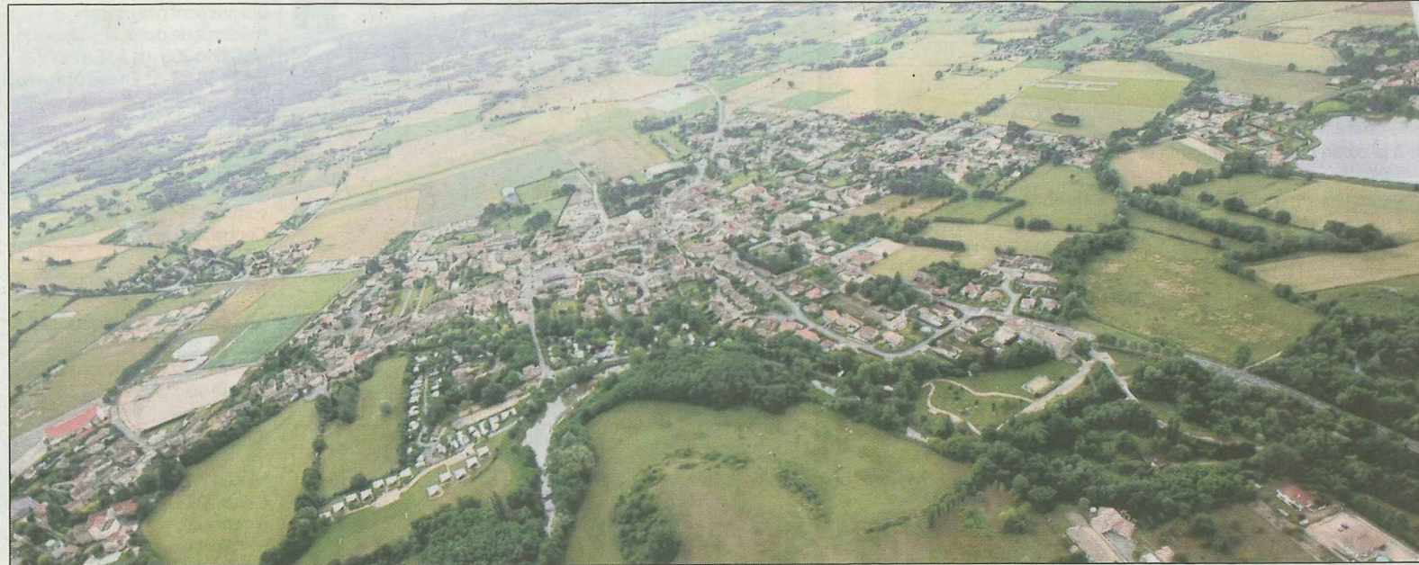
Bientôt, la création d'un plan d'eau à connotation équestre

Le tissu commercial et artisanal, et le parc d'activités intercommunal Actival, les nombreuses associations, l'école de musique, la bibliothèque, le camping