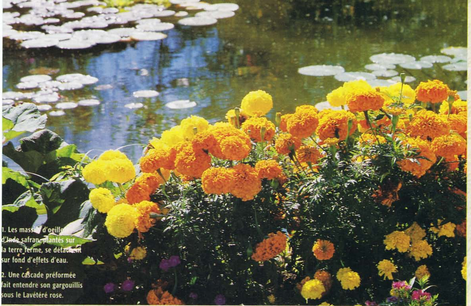
1. Les masses d'oeille d'Inde safran, plantés sur la terre ferme, se détachent sur fond d'effets d'eau. 2. Une cascade préformée fait entendre son gargouillis sous le Lavétéré rose.